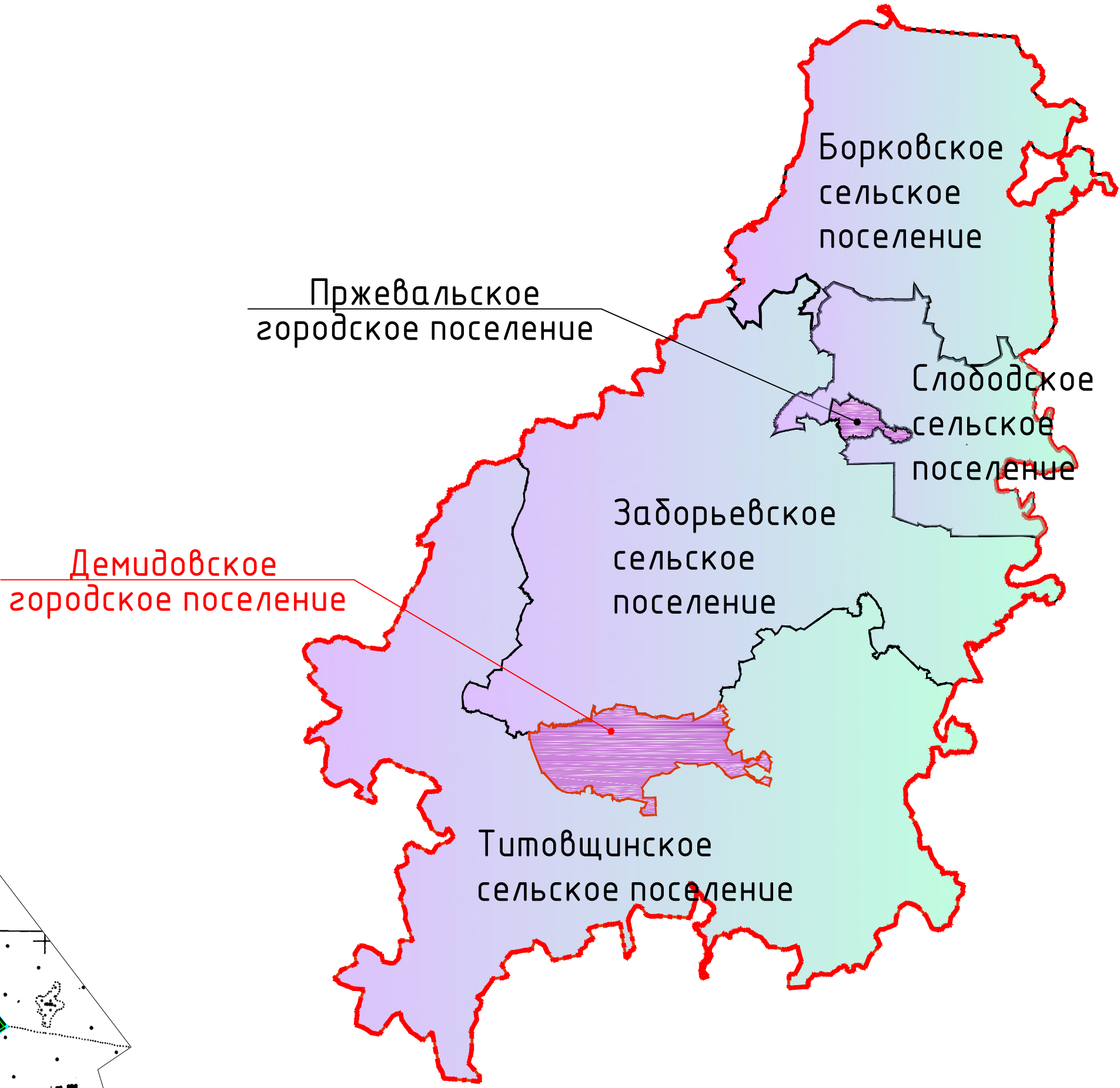
Схема расположения Демидовского городского поселения в Демидовском районе Смоленской области

Карта функциональных зон поселения. М 1:20000.