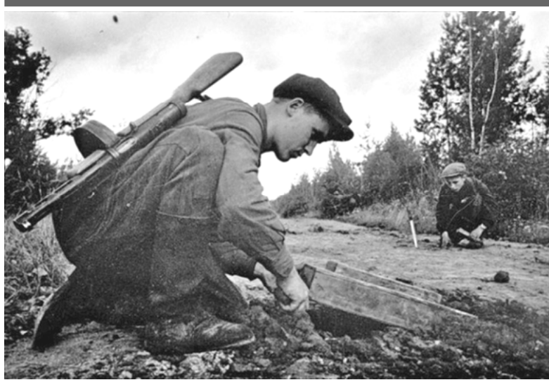
Партизаны минируют железную дорогу.