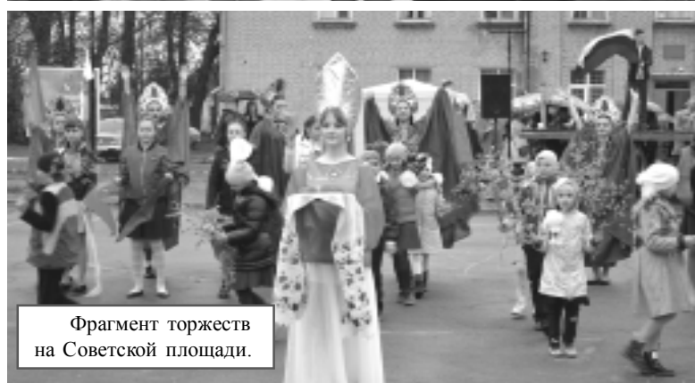
Фрагмент торжеств на Советской площади.