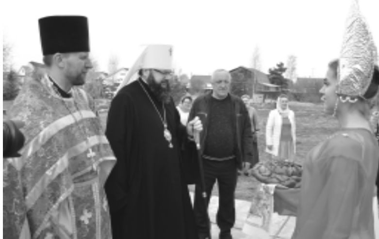
Встречали митрополита Исидора хлебом-солью.