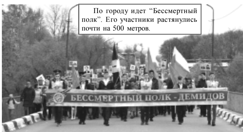
По городу идет "Бессмертный полк". Его участники растянулись почти на 500 метров.