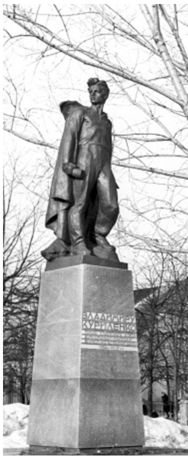
Памятник Володе Куриленко в г. Смоленск.

На место Володи Куриленко стали в нашем партизанском краю новые мстители. Нас теперь много в смоленских лесах. Нам многие тысячи. С каждым днем нас становится все больше. Знают гитлеровские разбойники, что недо-