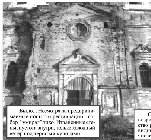
Было... Несмотря на предпринимаемые попытки реставрации, собор "умирал" тихо. Израненные стены, пустота внутри, только холодный ветер под черными куполами.

дооценивать себя и свои дела. Да, скромность хороша, но только не в нашем случае, не в нашей рубрике "Было-стало". В конце-концов, это нужно ее величество истории. И надо без всякого стеснения показывать достижения крайних лет. В противном случае, воспринимая все как должное, человек нивелирует (не видит) усилий и прогресса, ему кажется, что все приходит