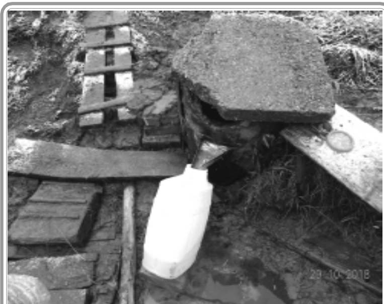
Живи, родник, живи... Твои равнодушные друзья не оставят тебя в таком состоянии, они еще придут к тебе на помощь.