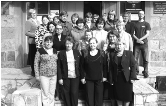
Коллектив Центральной районной библиотеки

Централизованная библиотечная система Демидовского района - это уникальный, универсальный интеллектуальный и социокультурный институт, место информационного и духовного общения, рождения новых идей, точка отсчета для многих интересных событий.