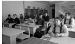
библиотеки Т.М. Черваневой 13 марта был проведен урок-практика «Модно быть здоровым»

Библиотекарем ЦСЗИ Демидовской центральной районной