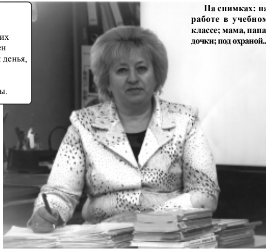
На снимках: на работе в учебном классе; мама, папа, дочки; под охраной...

Сколько хороших, добрых слов было и еще будет сказано в адрес наших дорогих учителей. Проходит время, меняется жизнь, что-то стирается и уходит в безвозвратное прошлое, остается неизменным лишь одно: любовь и благодарность - учителям. Людям, которые научили грамоте и всему тому, что необходимо нормальному, цивилизованному человеку в обществе. С трудом вспоминаем имена и фамилии тех, кто учил в училищах, техникумах и институтах, но имена и фамилии своих одноклассников и учителей помним всегда с особым трепетом и благодарностью. В 2015 году наши дети, сейчас учащиеся второго класса общеобразовательной школы № 1, переступили порог большого и светлого здания с названием «Школа». Для администрации и всего преподавательского состава школы этот 2015 год стал особенным, потому что впервые за последние годы на торжественной линейке выстроились сразу три первых класса и в каждом из них более двадцати учеников. Не передать, сколько было страхов, волнений и тревог. Волновались вовсе не дети, они еще даже приблизительно не знали, что их ждет впереди, волновались родители и учителя. Сейчас после первого года обучения можно с большой уверенностью сказать: нашим детям повезло. На пороге класса нас встретила прекрасная, опытный педагог Наталья Григорьевна Калининна, встретила, как родных, и уже после нескольких дней нашего тесного общения у всех сложилось впечатление, что знакомы