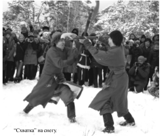
«Схватка» на снегу.

По окончании театрализованной части зрители могли поговорить с участниками действия, сфотографироваться с ними, а также запечатлеть себя в их амуниции и с оружием.