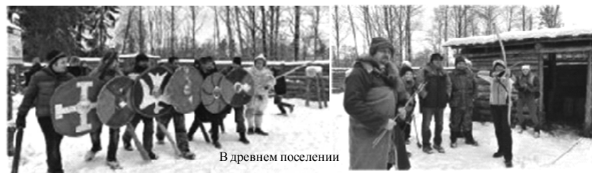
В древнем поселении

своеобразным прологом к более важным свершениям, случившимся 4 ноября 1612 года, в период так называемого Смутного времени, когда народное ополчение под командованием Кузмы Минина и Дмитрия Пожарского освободило захваченную поляками Москву, положив тем самым конец Смуте на Руси. Немалая заслуга в той победе принадлежала и защитникам смоленской земли - собственно, этим людям и был посвящен фестиваль «Смоленское Порубежье».