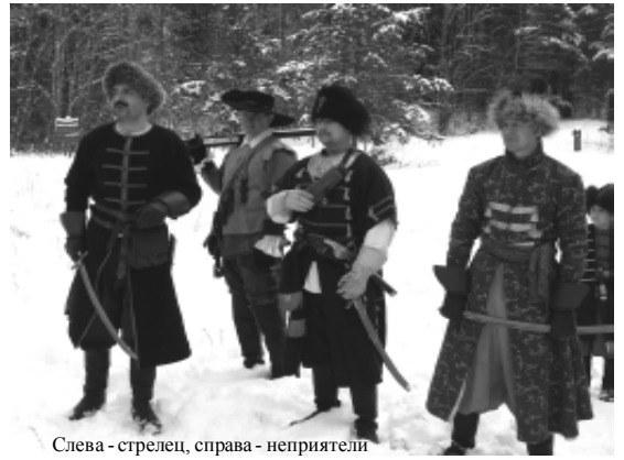
Слева - стрелец, справа - неприятели

токи» представили анимационную интерактивную программу, реконструирующую быт, оружие и воинские традиции наших предков, живших в X веке.