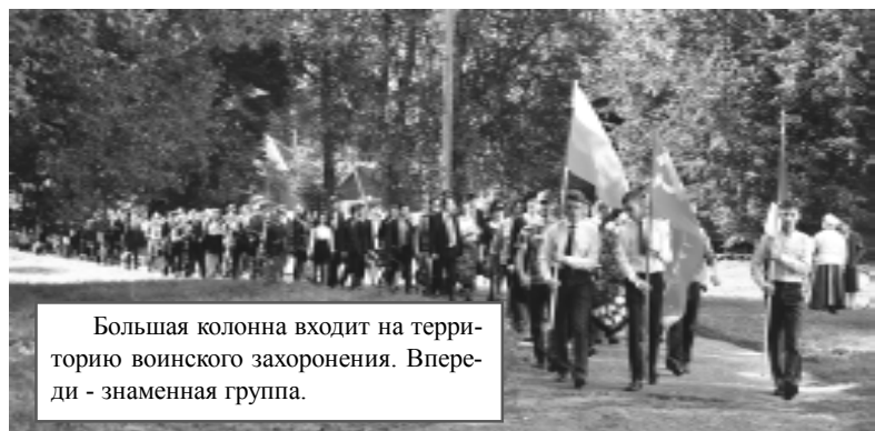
Большая колонна входит на территорию воинского захоронения. Впереди - знаменная группа.

21 сентября 1943 года был освобожден г. Демидов, 23 сентября - весь Демидовский район, 25 сентября - Смоленская область. Это официальная история, хотя бои в нашем районе продолжались вплоть до октября.