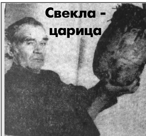
Свекла - царица

Ответ напрашивается такой: скорее всего над городом пролетел метеорит или звездочка упала. Но люди все равно верят в НЛО.