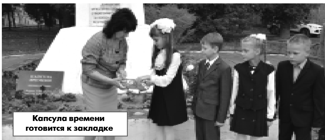
Капсула времени готовится к закладке