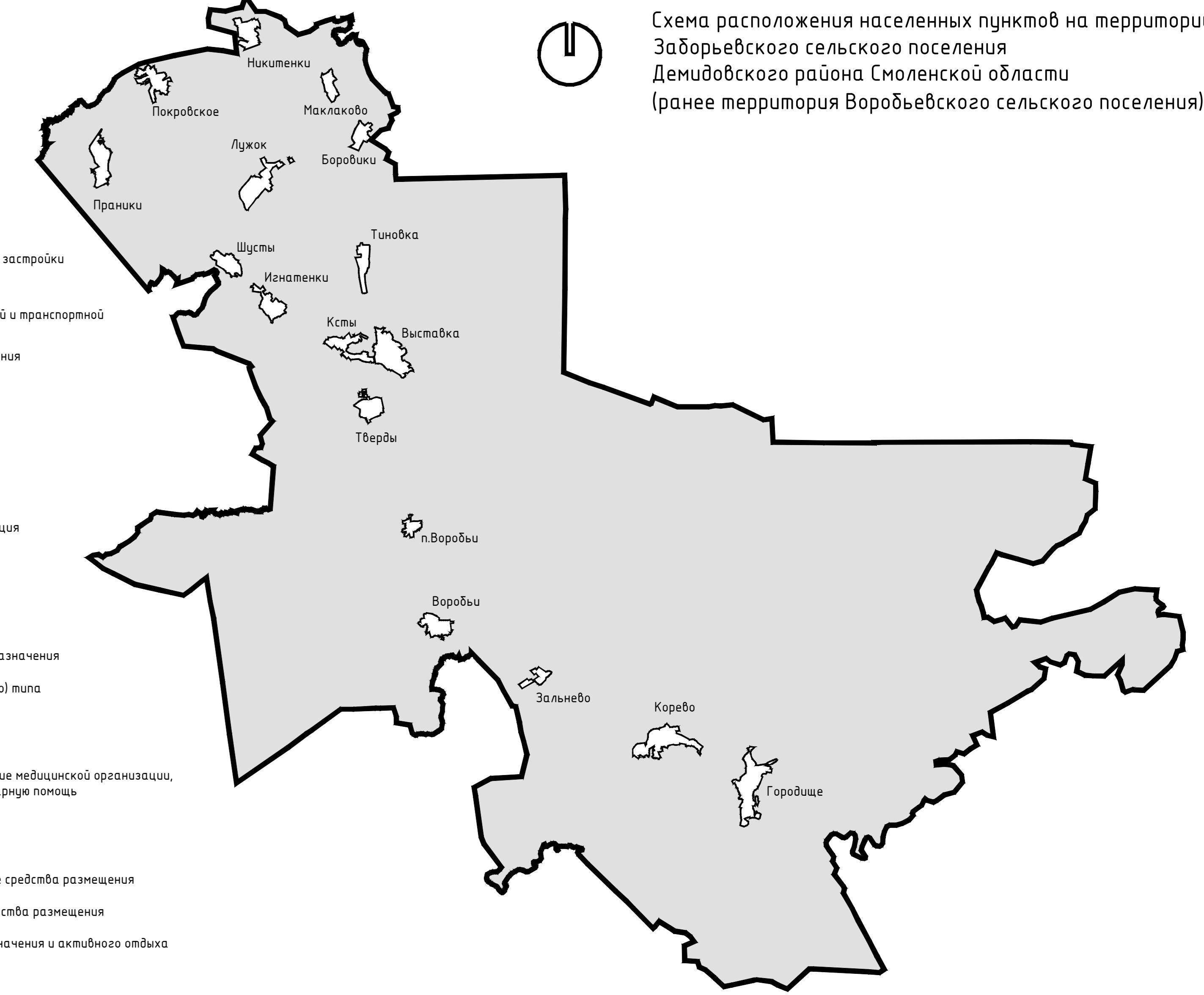
Схема расположения населенных пунктов на территории Заборьевского сельского поселения Демидовского района Смоленской области (ранее территория Воробьевского сельского поселения)