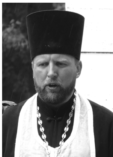
Протоиерей Александр Миронов