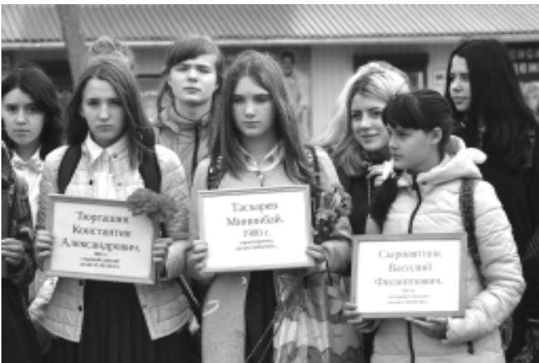
Возле «Журавлей» ученики средних школ г. Демидов держат в руках фоторамки с именами установленных красноармейцев.