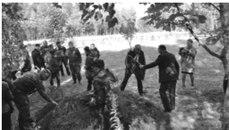
Возложение венков и цветов на свежее захоронение поднятых красноармейцев и сержантов.