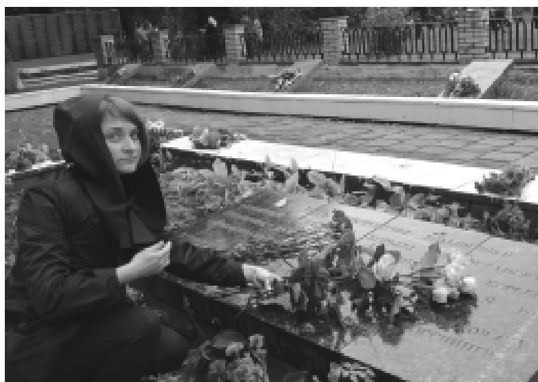
Цветы погибшим солдатам...