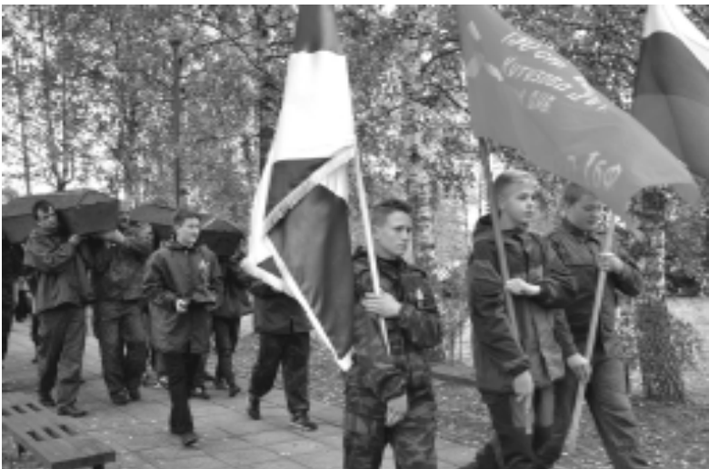
Останки поднятых воинов вносятся на Поле Памяти, впереди знаменосцы с флагом России, знаменами Победы и Смоленской области.