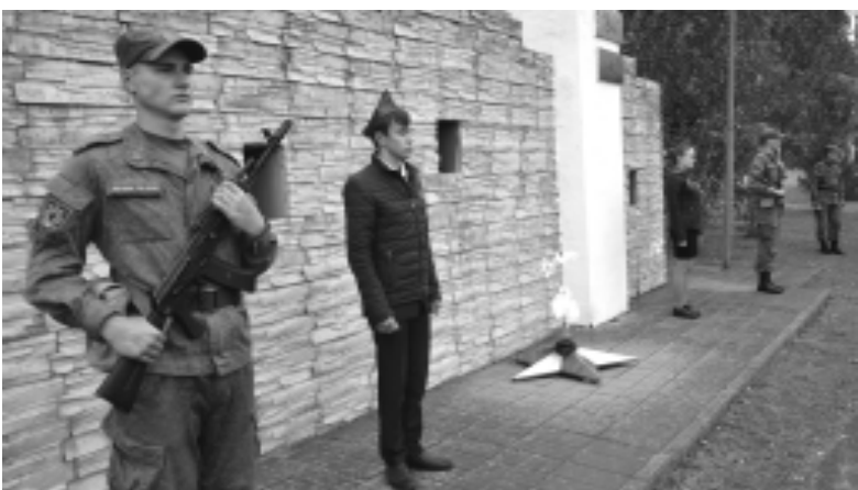
В карауле у вечного огня стоят солдаты воинской части, юнармейцы, ученики средних школ города.