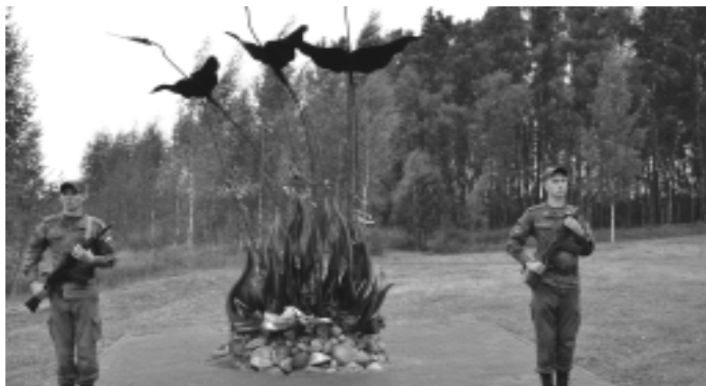
Почетный караул у памятника «Журавли» на Поле Памяти, собранный из осколков мин и снарядов.