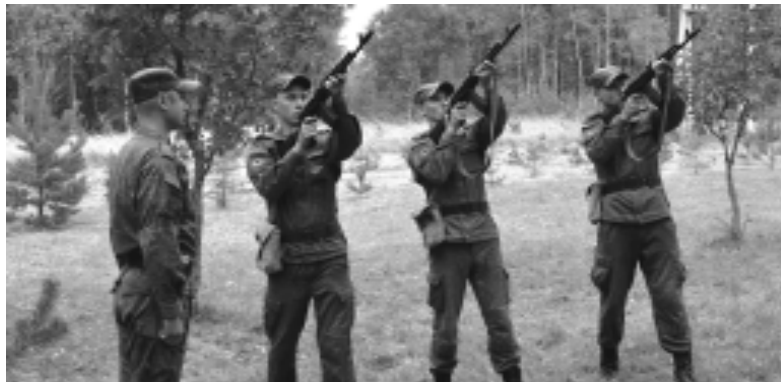
Залп из автоматов в память о погибших на Демидовской земле.