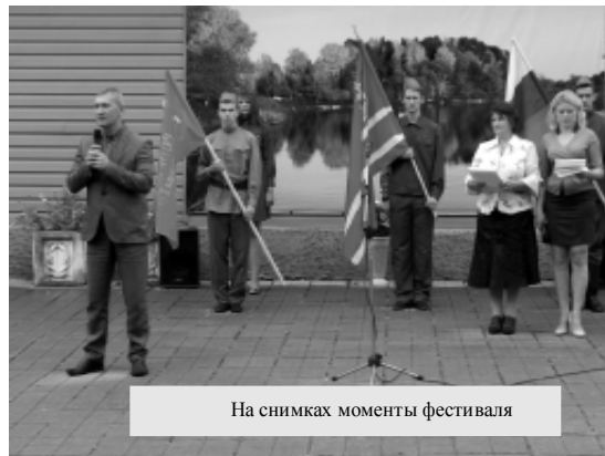
На снимках моменты фестиваля

После открытия фестиваля по центральной улице поселка не-