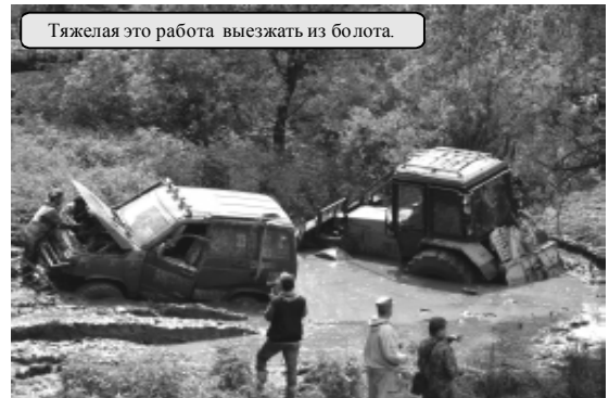
Тяжелая это работа выезжать из болота.