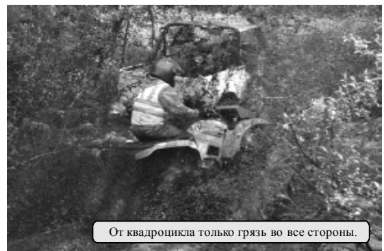
От квадроцикла только грязь во все стороны.

если не драма, то почти театральное представление экипажей, машин и моторов, где одним сопутствовала удача, другим пришлось или «сдаваться» топям, или приложить максимум усилий для «взятия» болота и крутого подъема. Играючи легко преодолевали болотную топь и крутой подъем оригинальные внедорожники необычного вида, сделанные специально для трофи-рейдов с умом и применением передовых технологий. Они, в отличие от «уазиков» и «нив», мало походили на обычные автомобили, скорее напоминали каких-то необычных живых существ. Вообще в машинах все подчинено выживаемости в труднейших условиях. Усиленные и высокие подвески, мощные моторы с дополнительным охлаждением, надежные мосты, высоко установленные аккумуляторы - это основные приметы, не считая скрытых секретов сверхпроходимости.