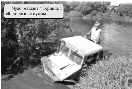
Чудо машина "Терпила": ей дороги не нужны.