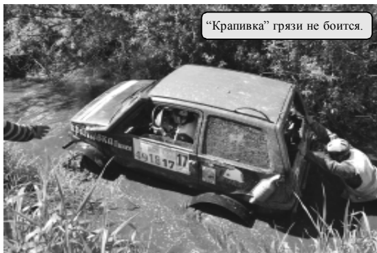
"Крапивка" грязи не боится.