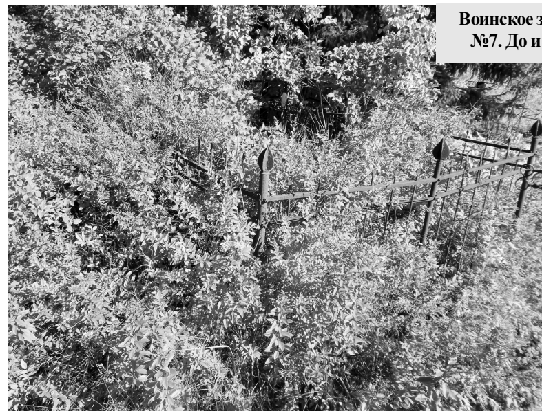
Воинское захоронение №7. До и после.