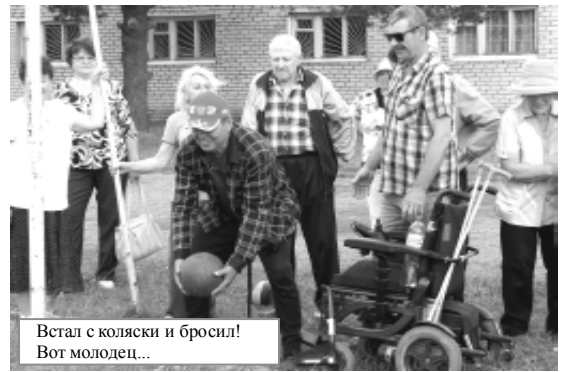
Встал с коляски и бросил! Вот молодец...